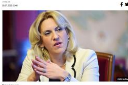
Željka Cvijanović Predsjednica Republike Srpske Željka Cvijanović rekla je da podržava akciju Glava Predsjedništva BiH iz reda srpskog naroda Milorada Dodika nakon preglasavanja u Predsjedništvu BiH da se protiv politike preglasavanja.