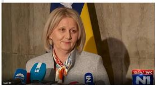
Zakonodavna vlast na državnoj razini je u ozbiljnoj krizi, ali i funkcioniranje čitave Bosne i Hercegovine...