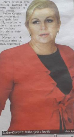
Grabar-Kitarović: Teške riječi u Izraelu

Predsjednica Hrvatske Kolinda Grabar-Kitarović ponovo je iznijela skandalozne i neosnovane tvrdnje i izmislila o Bosni i Hercegovini, i to u razgovoru s predstavnikom iz Izraela i razgovoru s predstavnikom iz zemlje Reuven Rivlinom. Veza s Iranom Hrvatska predsjednica kazala je, između ostalog, da je BiH nestabilna zemlja koju su preuzeli ljudi povezani s Iranom i terorističkim organizacijama. Ta je zemlja danas pod kontrolom militantnog islama, koji je dominantan u određivanju stavova - rekla je Grabar-Kitarović. Navela je i da skoro svi migranti sruške izbjeglice, a da su većinom zapravo afrički ili pakistanski migranti, koji se pokušavaju probiti preko granice iz Bosne i Hercegovine u EU.